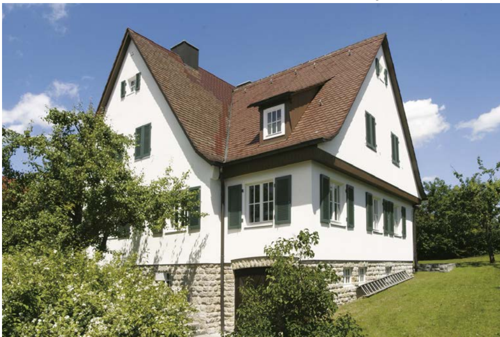
Bereits heute hinterlässt fast jeder zweite Erblasser seinen Nachkommen ein Eigenheim oder eine Eigentumswohnung.

Noch nie gab es in Deutschland eine Erbgeneration, die von ihren Eltern ein so hohes Vermögen zu erwarten hat. Laut Berechnungen des Forschungsinstituts empirica werden im Zeitraum von 2015 bis 2024 auf diese Weise in den privaten Haushalten 3,1 Billionen Euro den Besitzer wechseln. Im Schnitt werden pro Erbfall rund 363.000 Euro vermacht. Sicher, das ist ein typischer statistischer Durchschnittswert, der über das Testament von Herrn Müller oder Ehepaar Meier wenig aussagt. Lässt man die oberen zwei Prozent aller Hinterlassenschaften außen vor, liegt der Mittelwert aber bei 242.000 Euro. Maßgeblich für dieses hohe Erbvolumen ist, dass Immobilien bei immer mehr Nachlässen eine wichtige Rolle spielen.